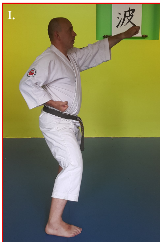
I. ippon-ken na strefę jodan w pozycji kiba-dachi