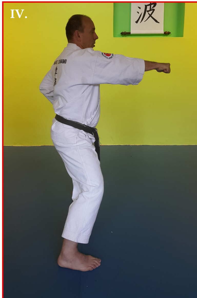
IV. ryuto-ken na strefę chudan w pozycji kiba-dachi