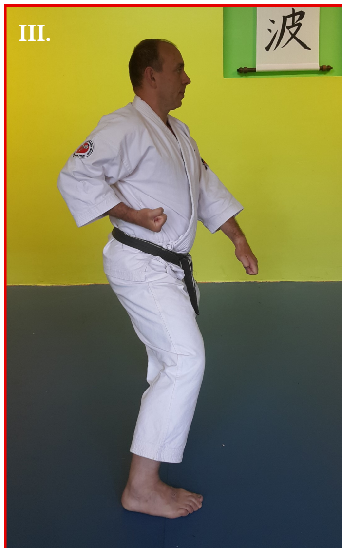
III. hira-ken na strefę gedan w pozycji kiba-dachi